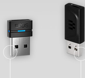
Dongle BTD USB-A